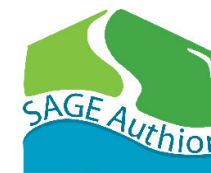
Schéma d'Aménagement et de Gestion des Eaux du bassin versant de l'Authion